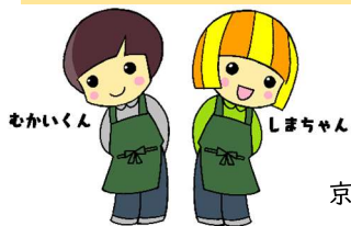
むかいくん しまちゃん