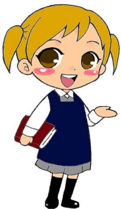
くぜふれあいこちゃん

そんな「スポーツの秋」に送る「図書館からのおすすめ本」のテーマは、スポーツの基本中の基本「走る」です。