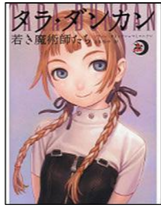
『タラ・ダンカン 若き魔術師たち 上・下』 ソフィー・オドゥワン ＝マミコニアン／著 山本知子／訳 KADOKAWA

ソルスリエ 生まれつきの魔術師・タラは、強すぎる魔力のせいで、嫌がらせを受け、闇の一族・サングラヴからも狙われます。そんな彼女には、頼りになる“最高の仲間”がいます。さまざまな困難をともに乗り越えたタラたちは、ついにサングラヴに挑みます。どんなときも味方になってくれる仲間の絆に感動せずにはられません！