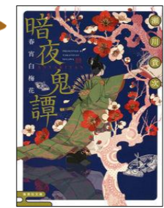
『暗夜鬼譚 春宵白梅花』 あんやきたん しゅんしょうはくばいか 瀬川貴次／著 集英社

宮中に鬼と赤子の足跡が現れた！この怪異に遭遇した少年武官・夏樹と猫をかぶった天才陰陽師見習い・一条は、優しすぎる乙女な馬頭の鬼・あおえを巻き込み、赤子の行方を追います。読み進めるうちに、性格がデコボコなのに息ぴったりなこのトリオから目が離せなくなります！