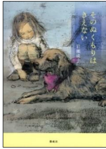
『そのぬくもりはきえない』 岩瀬成子／著 偕成社

あなたのためと言って、いつも先回りして答えを出してしまうお母さんに従っていた小学4年生の波。ある日、内緒で近所の犬の散歩の手伝いを始めます。その家の2階には幽霊がいるというのですが・・・。様々な出会いの中で自分の心の中の声を聴くようになり、波は、そしてお母さんも変わっていきます。