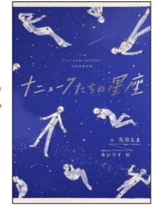
『ナニユークたちの星座』 雪舟えま／文 カシワイ／絵 アリス館

子どもにだけ見える光る石を採取するクローン「ナニユーク」たち。徐々に光が見えにくくなる主人公の37922号は、卒業して、かつて海辺の町で暮らすと約束をした親友を探すことに。親友は見つかるのか？こつぜんといなくなった理由は？優しいタッチの絵とともに進む、温かな物語。