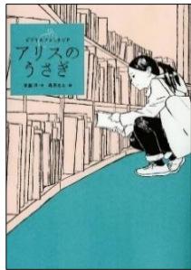
『アリスのうさぎ』 斉藤洋／作 森泉岳土／絵 偕成社

わたしは図書館の児童読書相談コーナーで働いている。ある日、有名中学の制服を着た中学生に、前ここにあった水色の問題集は？と聞かれるが見当たらない。その問題集には翌日のテストの問題が書かれているらしい。そのおかげで中学生の成績はだんだん上がっていくが・・・。淡々としたクールな短編集。