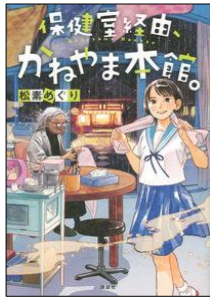
『健康室経由、かねやま本館。』 松素めぐり／著 おとないちあき／装画・挿画 講談社

憧れの東京に引っ越したサーマ。夢の中学生ライフが待っているはずだったのに、なぜか仲良しグループの中で浮き始めてしまう。そんな時に謎の保健室の先生に導かれ、たどり着いたのはステキな温泉「かねやま本館」。温泉にゆったりつかりながら、サーマは自分自身を見つめ直し・・・心温まるお話。