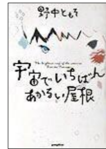
『宇宙でいちばんあかるい屋根』 野中ともそ／著 ポプラ社

中学生の「つばめ」と不思議な老女「星ばあ」は、暗闇の屋上で出会い、ともにヨル（夜）を過ごすうち、大切な人の家の屋根を探すことに。大切な人とは誰なのか？2人の絶妙なかかけ合いが魅せる、「駆けめぐる時間のひとこまひとこまが、泣きたいほどにいとおいしい」物語。