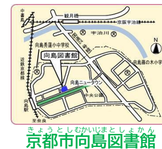
きょうとしむかいじまとしょかん 京都市向島図書館

はじめて人類が月に降り立ってから、50年以上がたちました。50年前とくらべると宇宙についてたくさん分かってきました。みなさんが大人になるころには、月で暮らすのも夢ではないかもしれません。そんな宇宙探査のいままでの歴史と、これからの計画について、わかりやすく書かれています。