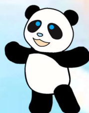
京都市洛西図書館