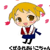
くぜふれあいこちゃん