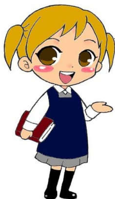
くぜふれあいこちゃん