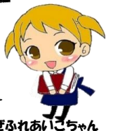
くぜふれあいちゃん