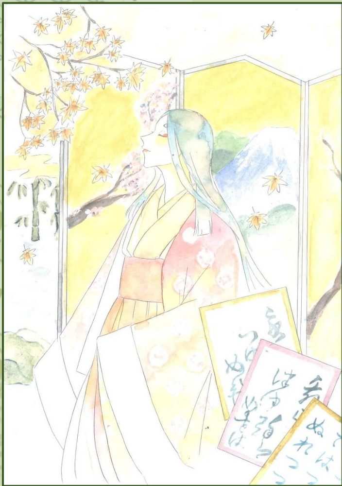
京都市立開建高等学校 ペンネーム 柚さんによる作品