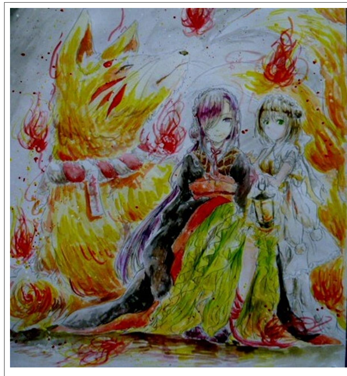
今号の表紙は、 まり 抹莉さんのイラストです。