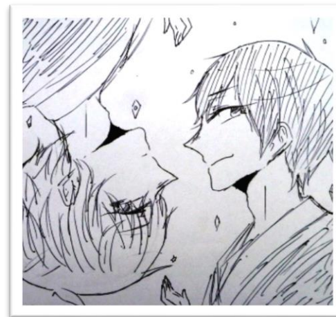
ペンネーム・ とあさん