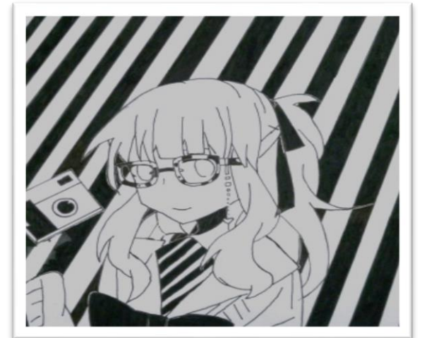
ペンネーム・ 瑚子さん