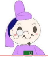
吉祥院図書館 マスコットキャラクター きっしょうくん

図書館だよりでは、吉祥院図書館の職員が、 小学生のみなさんに読んでほしいオススメの本を紹介いたします！ 新しい学年に上がり、どきどきの1年が始まりますね。 今回は、いろんな「どきどき」する本を紹介いたします。