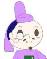
きっしょういんとしょかん 吉祥院図書館 マスコットキャラクター きっしょうくん

としょかん きっしょういんとしょかん しょくいん 図書館だよりでは、吉祥院図書館の職員が、 しょうがくせい よ ほん しょうかい 小学生のみなさんに読んでほしいオススメの本を紹介いたします！ ねん はじ ねん はじ 2026年が始まりました。あたらしい1年の始まりに、なにか あたらしいこと に ちょうせん してみませんか？