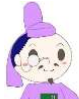
きっしょういんとしょかん 吉祥院図書館 マスコットキャラクター きっしょうくん

としょかん きっしょういんとしょかん しょくいん 図書館だよりでは、吉祥院図書館の職員が、 しょうがくせい よ ほん しょうかい 小学生のみなさんに読んでほしいオススメの本を紹介いたします！ ねん はじ ねん はじ 2026年が始まりました。あたらしい1年の始まりに、なにか あたらしいことを始めてみませんか？