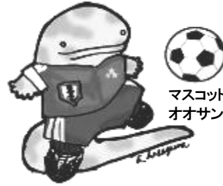
マスコットキャラクター オオサンショウウオの大ちゃんです