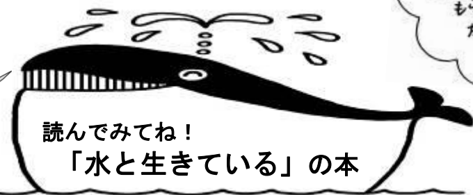
読んでみてね！ 「水と生きている」の本