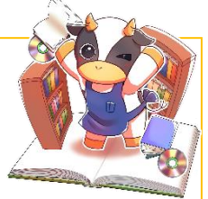
どいごちゅうおうとしょかん 醍醐中央図書館 こうしき 公式キャラクター よもうちゃん

ししょ しごとはっぴようかい にんていしき かいさい 司書のお仕事発表会・認定式』を開催しました!