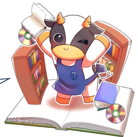
醍醐中央図書館公式キャラクター よもうちゃん