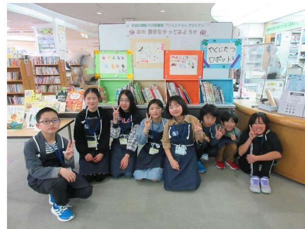
本の展示が完成しました！3/23まで展示しています