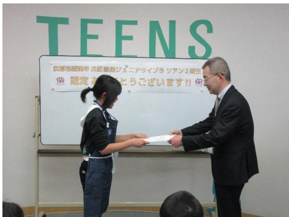
ひとりずつ賞状と認定証を受取りました