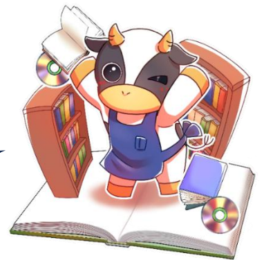
醍醐中央図書館公式キャラクター よもうちゃん