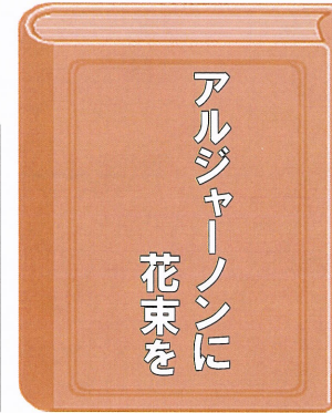
ダニエル・キイス著 小尾 芙佐訳 出版：早川書房

知的障害をもつ チャーリーは、 手術によって天才 的知能に変貌する。 やがて、周囲の人 がかつての自分に 向けていた感情に 気がつき…。