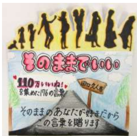
ペンネーム いちごさん 『そのままでいい 110万いいね！を集めた176の言葉』 田口久人／著