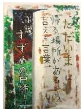
ペンネーム てるてる坊主さん 『小説 すずめの戸締り』 新海誠／著

入賞された作品以外にも、素敵な作品がたくさんありました！ 応募・投票してくださった皆さん、本当にありがとうございました！