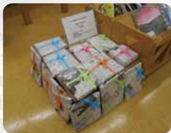
西京図書館(西京区)

面白と思った本の魅力を、5分で順番に紹介し、観戦者の投票で「チャンプ本」を決定します。春と秋の記念行事で定期的に実施しています。