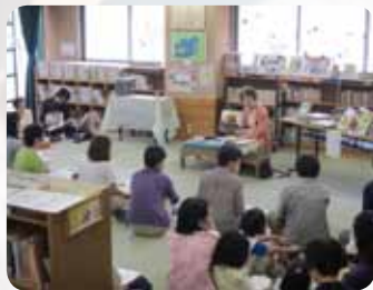
山科図書館(山科区):大角氏講演会