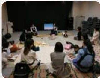
醍醐中央図書館(伏見区)