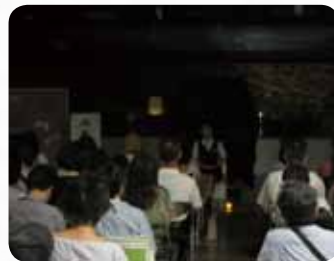
中央図書館(中京区)