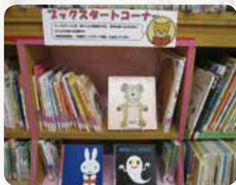
伏見中央図書館(伏見区)