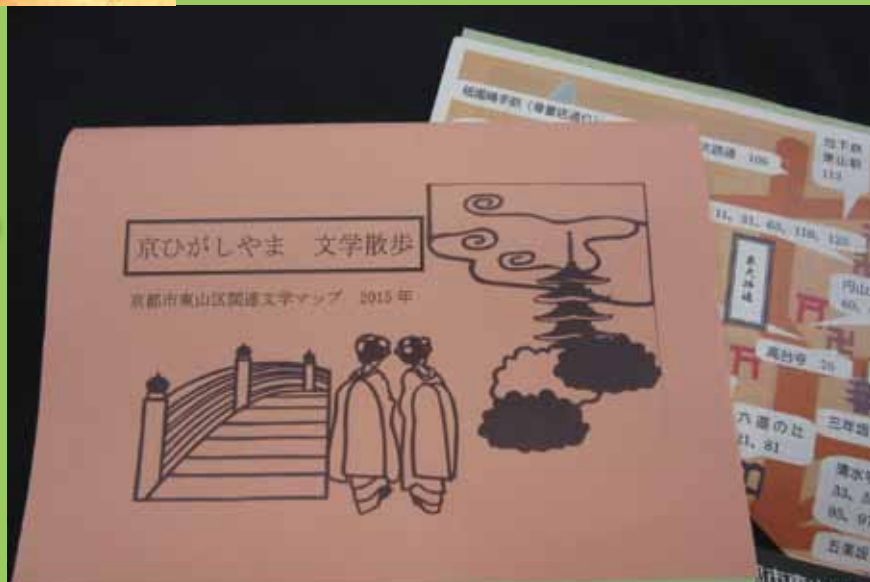
京ひがしやま 文学散歩(東山図書館)