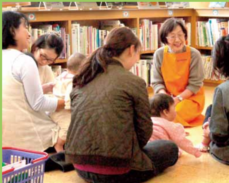
図書館友の会「けやき」さん(左京図書館)