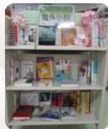
醍醐図書館(伏見区)