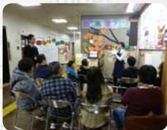
中央図書館(中京区)

赤ちゃんと保護者が絵本を介してふれあう、「京都版ブックスタート事業」で、保健センターの8か月健診の際に手渡される絵本を、いつでも手に取ってご覧いただけるコーナーを設置しました。